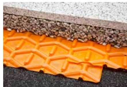
Solape de Schlüter®-TROBA

Debido a la colocación suelta sobre gravilla / grava, las cargas sobre un solo lado o en las esquinas pueden provocar de forma natural movimientos del pavimento.