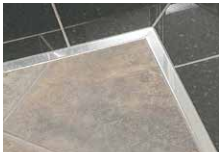
Schlüter®-DESIGNLINE-E en la zona del suelo

Tenga en cuenta siempre todas las instrucciones y normas de seguridad del fabricante de la herramienta de corte, incluidas las gafas de seguridad, la protección auditiva y los guantes. Independientemente de la herramienta de corte utilizada, todas las rebabas del extremo del perfil se deben retirar con una lima o herramienta similar antes del montaje.