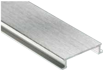
Schlüter®-DESIGNLINE-AGBE anodizado cepillado (-ACGB)