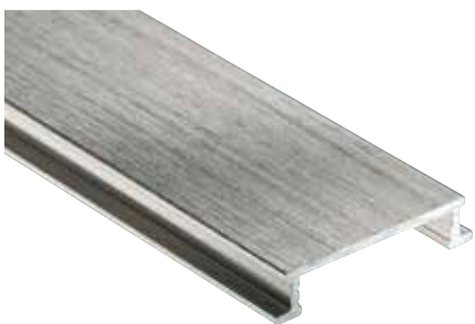
Schlüter®-DESIGNLINE-ATGB anodizado cepillado (-ATGB)

DESIGNLINE-E está fabricado a partir de tiras de acero inoxidable V2A (material 1.4301 = AISI 304). El acero inoxidable está especialmente indicado para aplicaciones con altas agresiones mecánicas y químicas, p. ej., en aquellas zonas donde se emplean medios y productos de limpieza ácidos o alcalinos. El acero inoxidable no resiste a todas las agresiones químicas, por ejemplo, al ácido clorhídrico y fluorhídrico o a determinadas concentraciones salinas y de cloro. Este hecho en determinados casos también es aplicable a las piscinas de agua salada. Agresiones especiales se deben comprobar antes de la instalación de los perfiles.