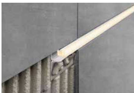
Instalación con iluminación acentuada Módulo LED LIPROTEC-LLPM

Por ello, se deberá eliminar de forma inmediata, cualquier resto de cemento o material de rejuntado que este en contacto con la superficie. El perfil deberá estar en contacto con el azulejo en su totalidad, para evitar de ese modo la acumulación en los huecos, de agua alcalina.