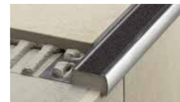
Schlüter®-TREP antideslizantes para escaleras.