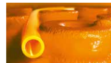
Schlüter®-BEKOTEC-THERM El pavimento de cerámica climatizado.