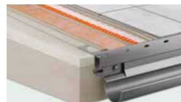
Schlüter®-Sistemas para balcones: solución completa para la construcción y el saneamiento de balcones y terrazas.