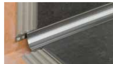
Schlüter®-DILEX Sistema de perfiles para la creación de juntas de movimiento y con protección de los cantos.

¿Desea saber más sobre otros productos y soluciones de sistema Schlüter para la colocación de baldosas? Nuestros distribuidores disponen de los siguientes folletos explicativos. Asimismo encontrará más información en nuestra página en Internet www.schluter.es .